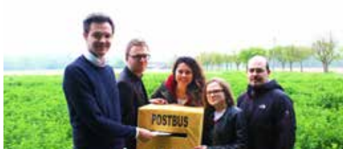
Jong N-VA Rhode lanceert 'postbus V' p. 2