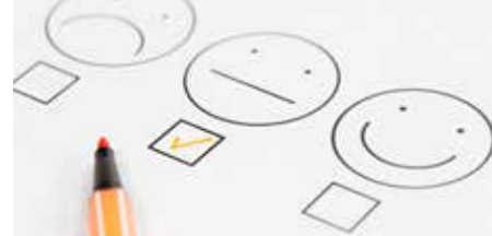
Iedereen burgemeester! p. 4 - 5